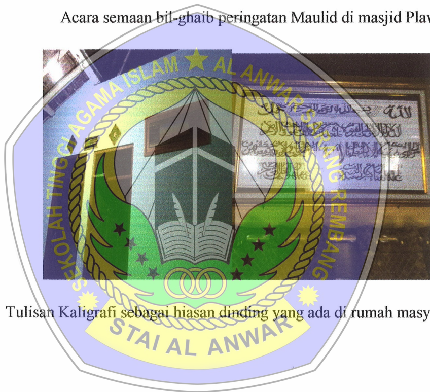
Tulisan Kaligrafi sebagai hiasan dinding yang ada di rumah masyarakat