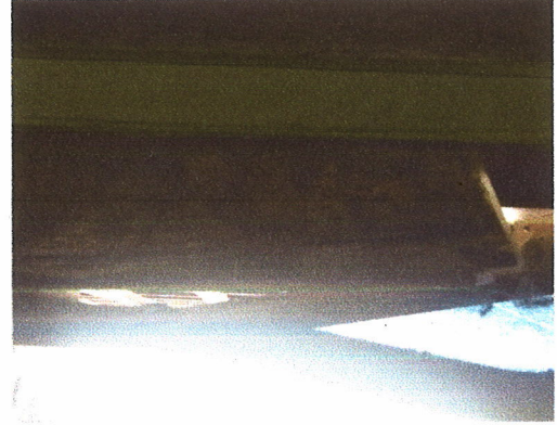
kaligrafi sebagai penjaga rumah