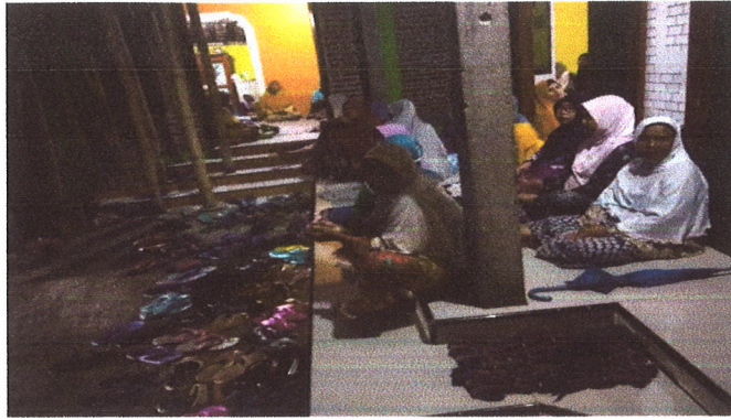
Ibu-ibu pengajian umum