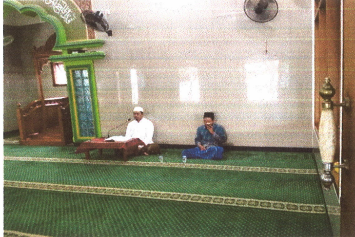
Acara semaan bil-ghaib peringatan Maulid di masjid Plawangan