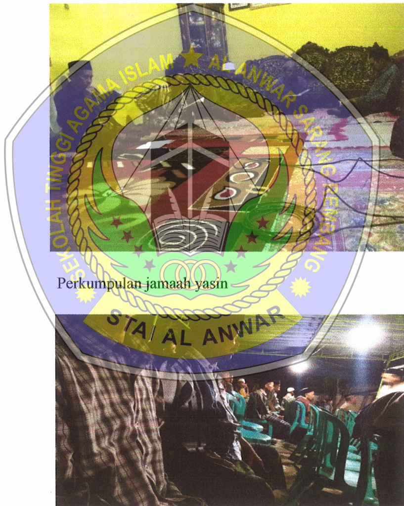
Perkumpulan jamaah yasin