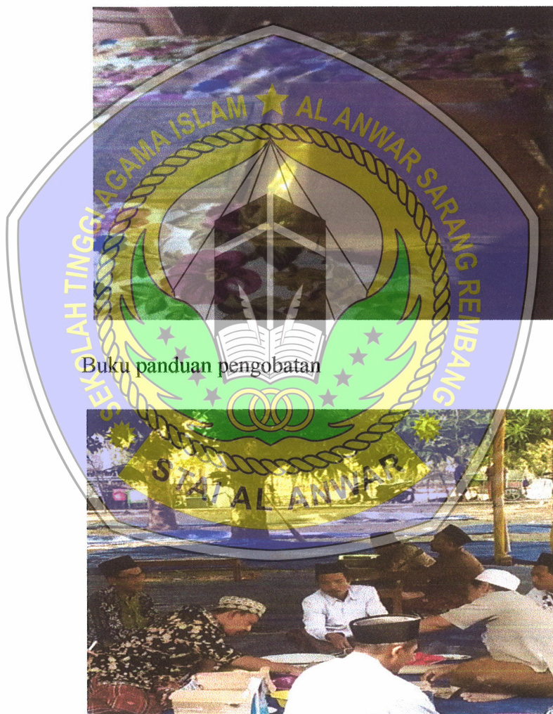
Buku panduan pengobatan